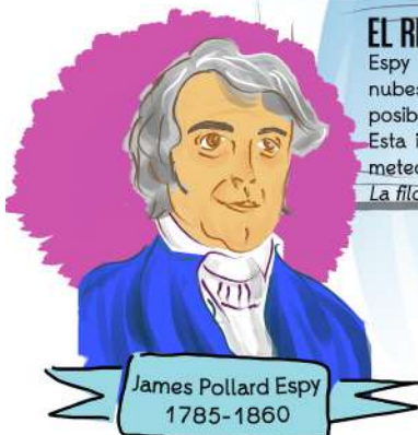
James Pollard Espy 1785-1860

Fue un corsario inglés que navegó por todos los mares del mundo. Era escritor, botánico y científico aficionado. En China conoció los tifones y dijo que eran "una especie de violentos remolinos". En aquella época se desconocía que las tormentas se movían de un lugar a otro.