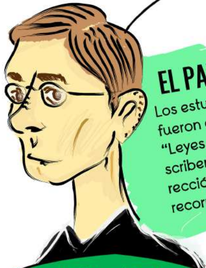
Benet Viñes Martorell 1837-1893

En 1831 descubrió que los huracanes giraban en dirección contraria a las agujas del reloj, con una sección en calma y siendo sus vientos extremadamente intensos. Fue el primero que propuso que los huracanes eran vórtices grandes y circulares.