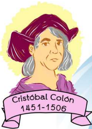
Cristóbal Colón 1451-1506

Los llamados "cazadores de huracanes" son investigadores que estudian de manera directa estos fenómenos hidrometeorológicos. Esta labor es peligrosa porque ingresan a los huracanes para estudiarlos desde su interior.